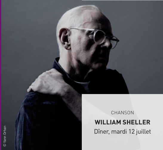
CHANSON WILLIAM SELLER Dîner, mardi 12 juillet