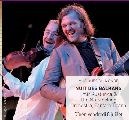
MUSIQUES DU MONDE NUIT DES BALKANS Emir Kusturica & The No Smoking Orchestra, Fanfara Tirana Dîner, vendredi 8 juillet