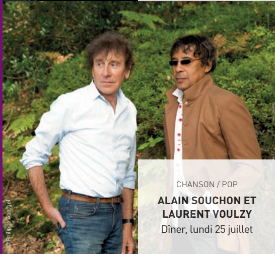
CHANSON / POP ALAIN SOUCHON ET LAURENT VOULZY Dîner, lundi 25 juillet