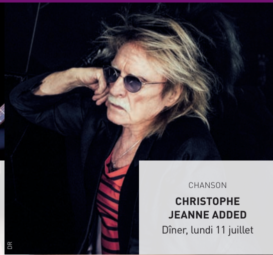
CHANSON CHRISTOPHE JEANNE ADDED Dîner, lundi 11 juillet