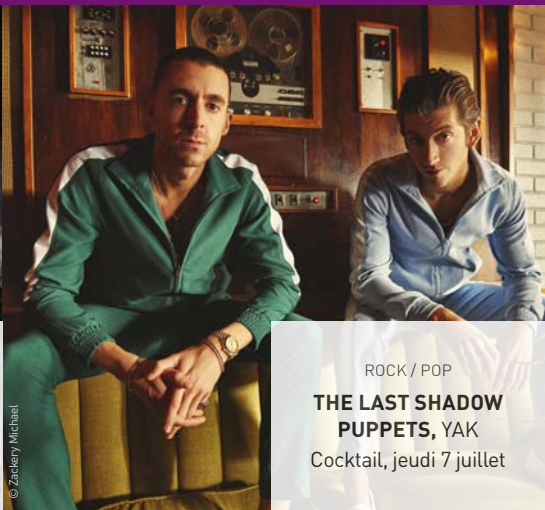
ROCK / POP THE LAST SHADOW PUPPETS, YAK Cocktail, jeudi 7 juillet