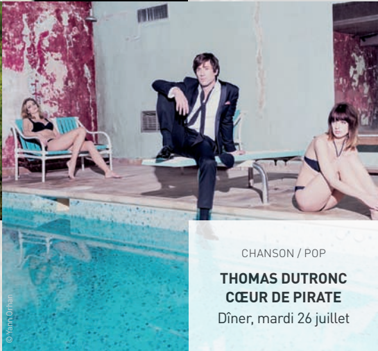
CHANSON / POP THOMAS DUTRONC CŒUR DE PIRATE Dîner, mardi 26 juillet