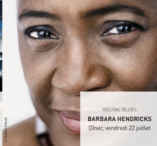
RÉCITAL BLUES BARBARA HENDRICKS Dîner, vendredi 22 juillet