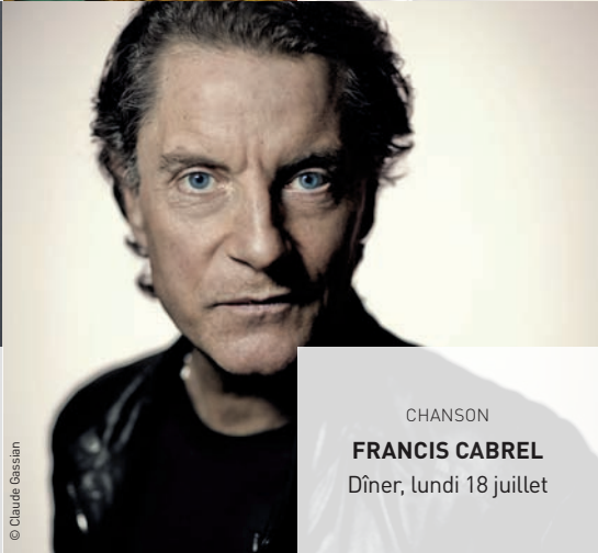
CHANSON FRANCIS CABREL Dîner, lundi 18 juillet