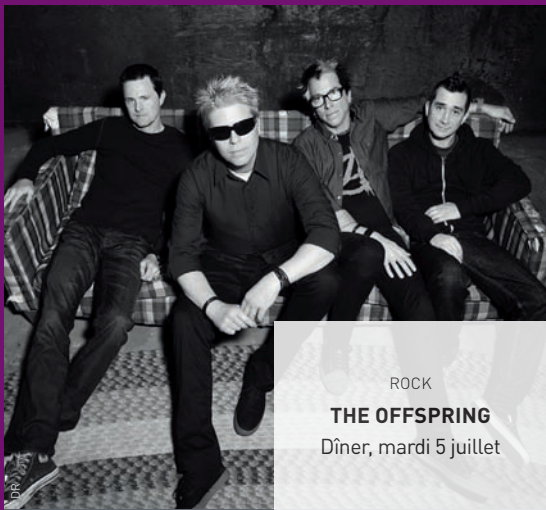
ROCK THE OFFSPRING Dîner, mardi 5 juillet